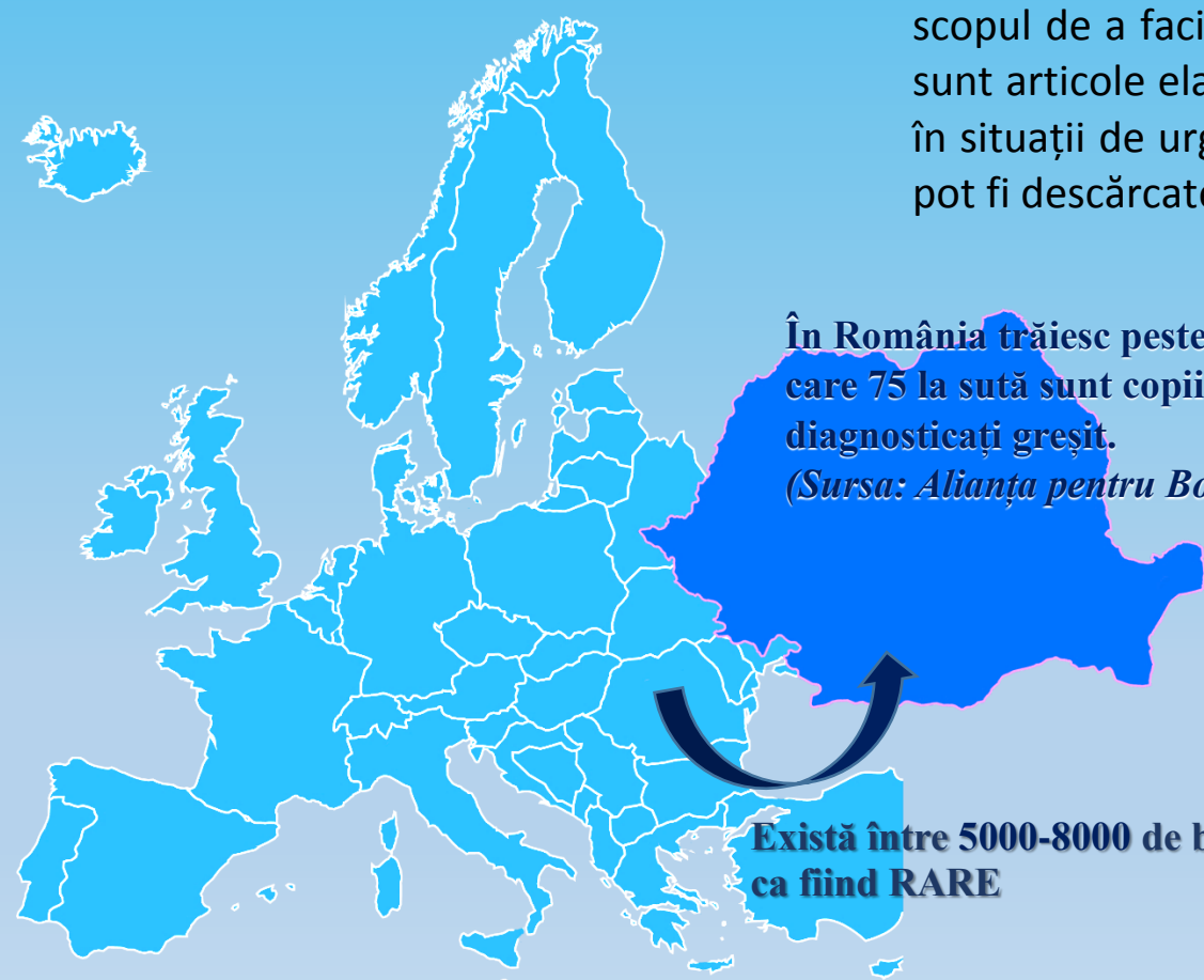
Prevalența bolilor rare în populația României

În Europa bolile rare afectează 6-8% din populație, în total 27-36 milioane de oameni.